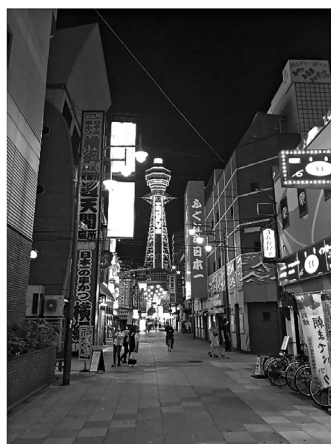
図表 5 替え作業中の連絡橋と新世界の繁華街（2020年9月）

ンなど、景気刺激策が必要との声が上がっているものの 25) 、知見の無い病原体との両立はなかなか難しいものがある。